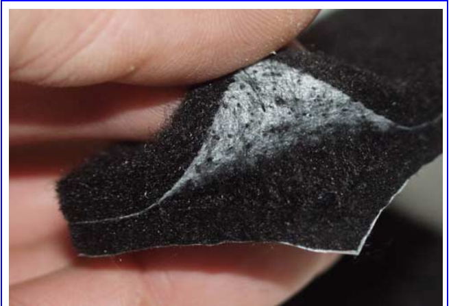
Auch Bitumen & Co sind überflüssig: Die untere Schicht Microfasern ist hochdicht verwoben und bringt die nötige Masse ein. An der weissen Stabilisierungsschicht kann die Matte gespalten werden. Die Abermillionen feinsten Fasern können in der Aufnahme erahnt werden.