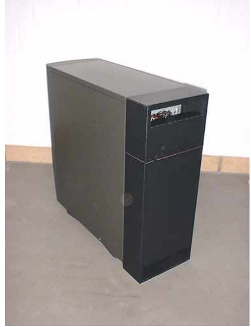
Packungsinhalt mit Außen- und Innenansicht des Kastens This should come with your Magic Vent